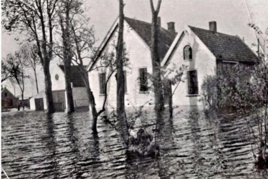
De oude hoeve 'Vaders Wensch' van de familie Markus aan de 1 e Tochtweg

Besloten is om de wisselexpositie 'Een Duitse waterlinie' te verlengen: 75 jaar geleden duurde de inundatie ook tot in mei. Voorop prijkt weer een Strömann-aquarel uit 1944. Hieronder staan inundatiefoto's uit diverse bronnen!