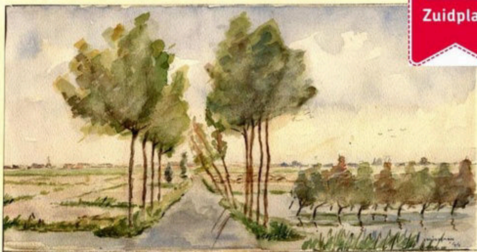
NIEUWERK • ZUIDPLAS POLDER

'Nieuwerkerk Zuidplaspolder', uitweg tussen de 1 e en de 2 e Tocht, aquarel van W.M. Strörmann uit 1944 (coll. hoogheemraadschap van Schieland en de Krimpenerwaard)