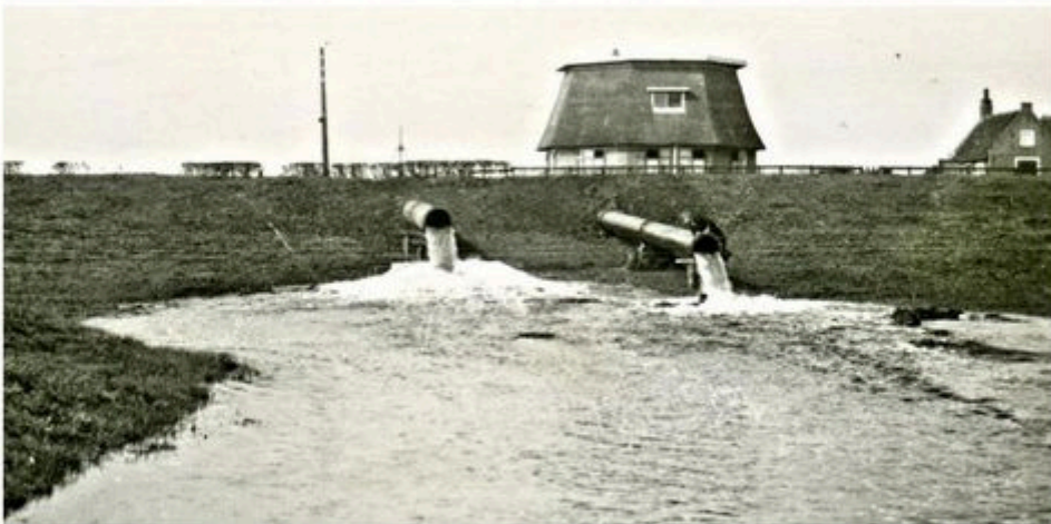
Inlaatbuizen uit de Ringvaart, gezien vanaf de net Zevenhuizense Onderweg en tegenover een molenstomp