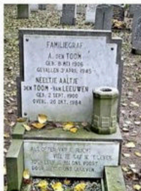
Oude Begraafplaats nu