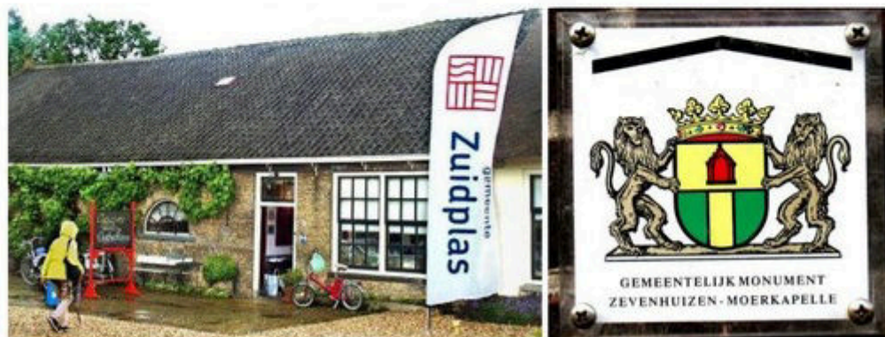
Oudheidkamer met Zuidplasbanner

In 2016 liet de gemeente voor roeikampioenschappen het lied Zuidplas Gewoon Grenzeloos maken en uitvoeren. De HVN zette 'Parel achter de dijken' in 2019 op haar website onder Historie & Beeld. De wisselexpositie is natuurlijk breder, heeft ook een Zuidplascanon 2010-2020, ga de vitrinetentoonstelling bekijken vóór 3 april!